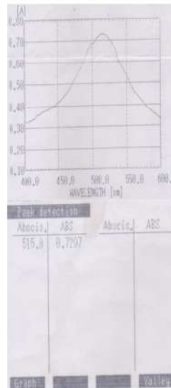
Gambar 1. Spektrum pengukuran panjang gelombang maksimum DPPH

Uji aktivitas antioksidan bertujuan untuk mengetahui kemampuan suatu senyawa sebagai antioksidan. Metode yang digunakan adalah metode DPPH ( 1,1 difenil- 2 pikrilhidrazil ). Pengukuran aktivitas antioksidan diawali dengan penentuan panjang gelombang maksimum DPPH.