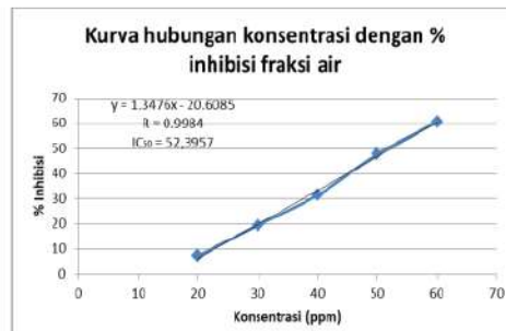
Gambar 4. Kurva hubungan konsentrasi dengan % inhibisi fraksi air

Pengujian aktivitas antioksidan pada fraksi air dilakukan untuk mengukur aktivitas antioksidan pada sampel fraksi air daun salam terhadap radikal bebas DPPH.