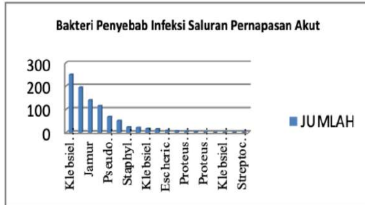
Gambar 1. Prevalensi Temuan Jenis Bakteri Penyebab ISPA di Rumah Sakit Umum Islam Klaten pada periode Januari 2020 sampai Februari 2022

Berdasarkan hasil penelitian yang dilakukan di laboratorium mikrobiologi klinik Rumah Sakit Umum Islam Klaten pada periode Januari 2020 sampai Februari 2022 terhadap sampel kultur sensitivitas sputum keseluruhan pasien, penyebab bakteri Klebsiella pneumoniae 250 pasien.