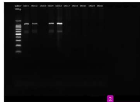
Gambar 4. Visualisasi keberadaan gen oxa-23 dari isolat klinis bakteri Acinetobacter baumannii (10 sampel, sampel IA011 – IA026)

Gen oxa-23 tervisualisasi pada 8 dari 20 sampel DNA yang berasal dari isolat klinis bakteri A. baumannii yang berasal dari RSUD Dr. Moewardi. Adapun kedelapan sampel DNA bakteri A. baumannii yang positif keberadaan gen oxa-23 dikenali dengan identitas sampel IA001, IA002, IA004, IA010, IA011, IA012, IA014 dan IA015.