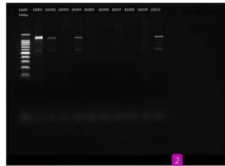
Gambar 3. Visualisasi keberadaan gen oxa-23 dari isolat klinis bakteri Acinetobacter baumannii (10 sampel, sampel IA001 – IA010)

Dari hasil amplifikasi isolat DNA di PCR, kedua puluh produk isolat DNA masing-masing diambil 5 \mu l isolat DNA, untuk dicampurkan masing-masing dengan 1 \mu l loading dye dan 2 \mu l gel red diatas kertas parafilm. Hasil pencampuran tersebut dimasukkan ke dalam sumuran gel agarose untuk dilanjutkan proses elektroforesis. Elektroforesis dilakukan dengan pengaturan tegangan 90 V, kuat arus 400 mA, selama 60 menit. Gel agarose hasil elektroforesis lantas dimasukkan ke gel doc dengan hasil visualisasi seperti pada Gambar 3 dan 4.